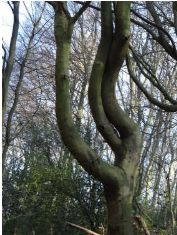
Es tanzt ...