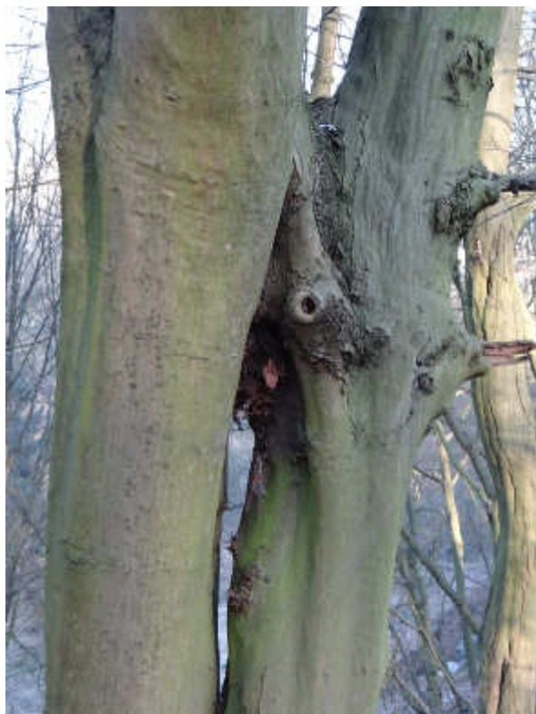
Und küsst ...