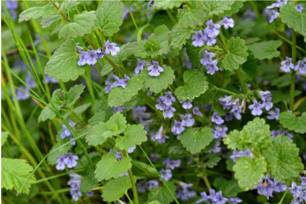
Gundermann