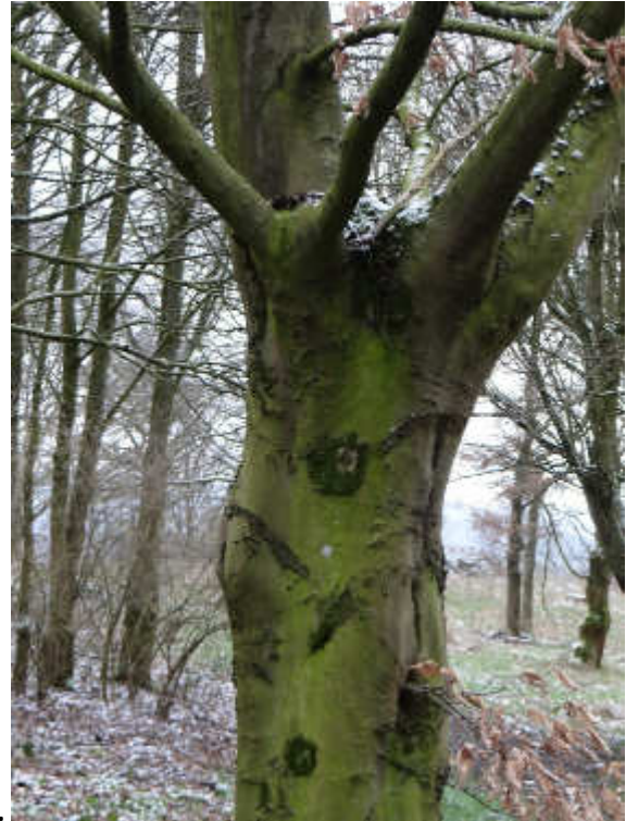
und guckt ...