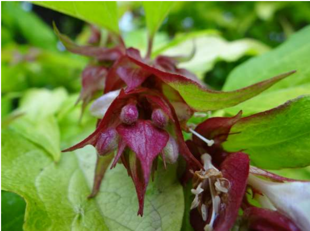
Höchstens der guckt mal ... (aus England, Abbotsbury subtropical garden), Karamellstrauch